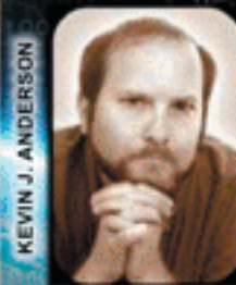
KEVIN J. ANDERSON