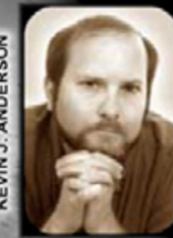
KEVIN J. ANDERSON